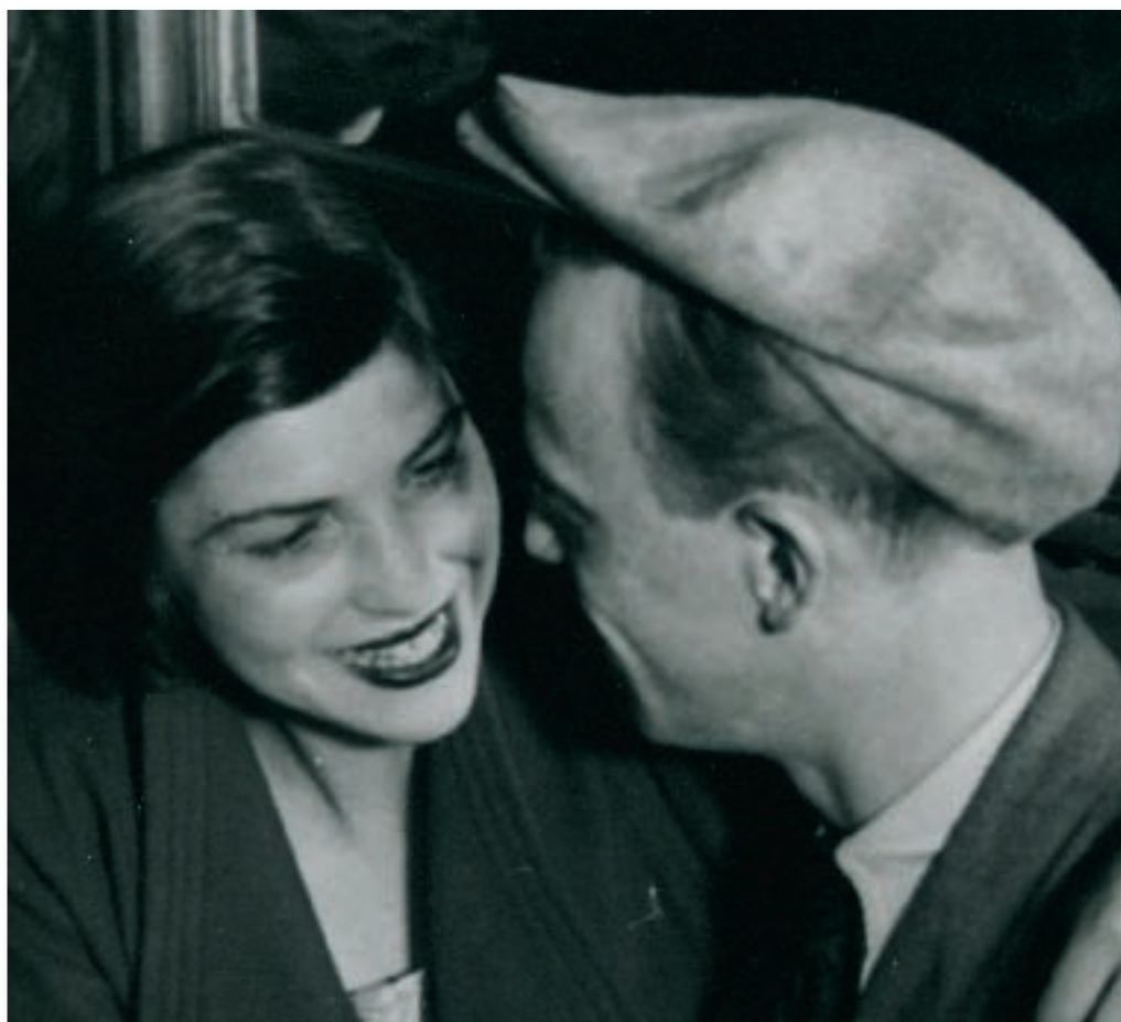
55 903 € frais compris (détail, voir page 50).