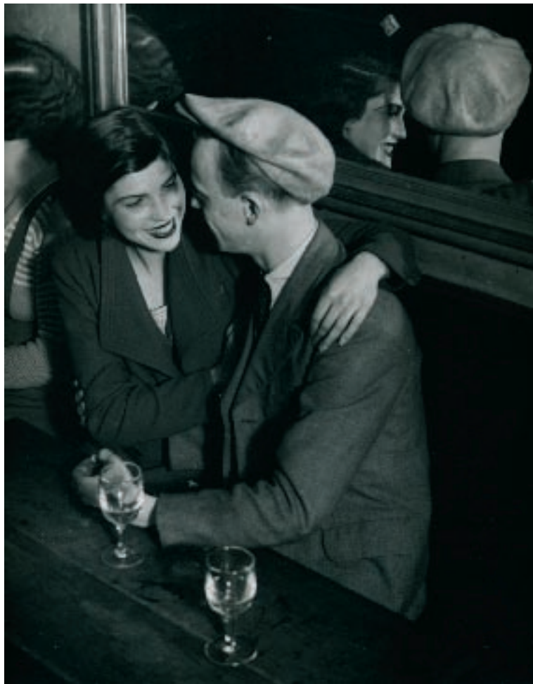
55 903 € frais compris. Brassaï (1899-1984), Couple d'amoureux assis, bal musette des quatre saisons, rue de Lappe, vers 1932, tirage monté sur Isorel, vers 1960. 37,2 x 49,5 cm.