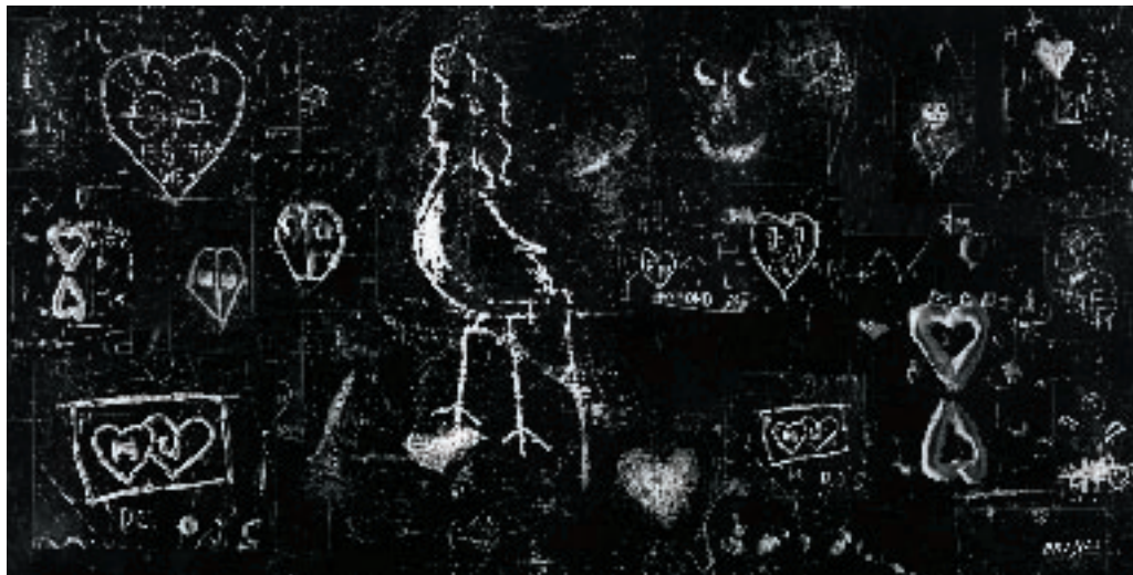
206 897 € frais compris. Brassai (1899-1984), Graffiti I, vers 1968, carton de tapisserie composé de 23 photographies découpées et assemblées, montées sur panneau de bois, rehauts de gouache noire. 140 x 170 cm. Record mondial pour une œuvre de l'artiste.

sous la direction du même maître d'œuvre dans l'atelier du Marais, une tapisserie de basse lisse de 1972, Samourai (140 x 120 cm), respectait à 5 000 € son estimation basse. Elle est également composée à partir de graffitis. Brassai a commencé à les photographier en 1932. En décembre 1933, il en présente quelques-uns dans la revue Minotaure . Ces « témoignages éphémères et sauvages » sont pour lui bien plus que des inscriptions gravées sur des murs. Ils constituent avant tout une réflexion sur la trace et sur les origines de l'écriture. Ils permettent aussi de méditer sur la notion de temps et sur la fonction du beau. D'abord incompris par le public parisien, les graffitis seront célébrés à New York lorsqu'ils seront exposés au MoMA en 1956. Les soixante et onze graffitis proposés dans la vente – y compris la composition du record – ont totalisé 473 200 €. La deuxième meilleure enchère de cet ensemble, 40 000 €, allait au tirage d'exposition de Graffiti (Série IX, images primitives) (79,7 x 108 cm), probablement réalisé par le laboratoire Picto vers 1960. Il respectait son estimation basse. Ce n'était pas le cas du tirage d'exposition de Graffiti, le Roi Soleil (39 x 49,5 cm), issu de la même série que le précédent, poussé jusqu'à 27 000 € sur une estimation haute de 10 000. Un succès équivalent attendait à 20 000 € le tirage d'exposition (39 x 50 cm) vers 1960 de Graffiti (Série VIII, la magie) .